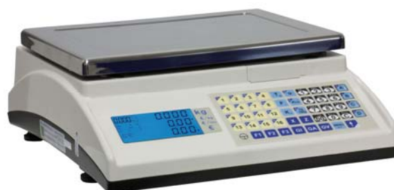
Marte 10 V4

Balanza sobre mostrador, multifunción, Peso-Tara, Niveles y Cuentapiezas