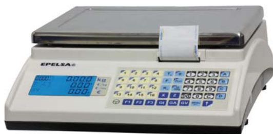
Marte 10 V4 IC

Balanza sobre mostrador, etiquetadora, especial para trabajo en self-service.